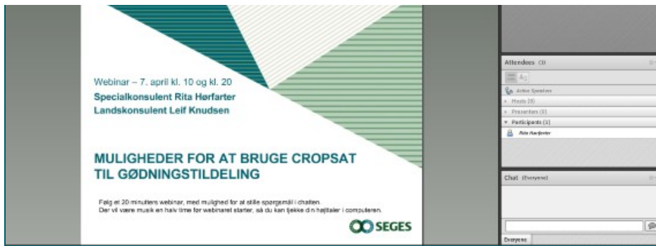
Figur 2. Du er nu kommet ind på webinar om omfordeling af gødning med CropSAT. I nederste højre side står "Chat". Det er her du kan skrive dine spørgsmål. Når spørgsmålet er skrevet trykker du på "Everyone".